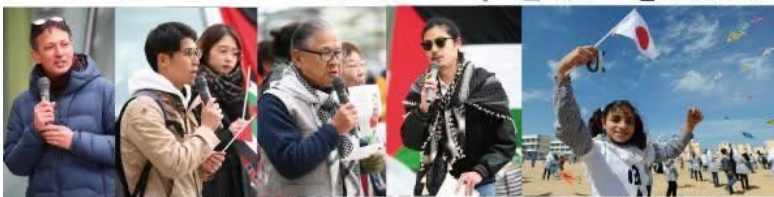
写真右：震災で被災した日本に向けて応援の風揚げアクションを行ったガザの人たち