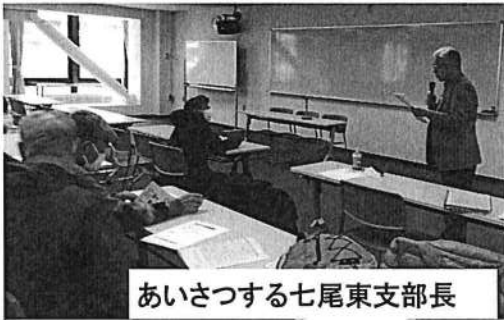
あいさつする七尾東支部長

2013年から13年間連続して年金が引き下げられ、累計で8.6%も目減りしました。物価高騰の中、暮らしが立ちゆかない事態になっています。マクロ経済スライドを直ちに辞めさせ、物価スライド制に戻すことが解決策です。