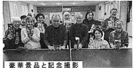
豪華景品と記念撮影