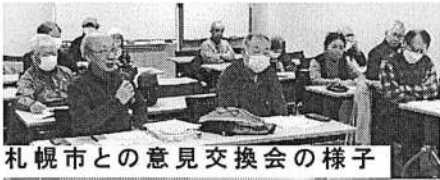
札幌市との意見交換会の様子

は、マイナ保険証の人でも高齢者・障害者には申請があれば、資格確認書の発行を柔軟に対応するとの回答でした。「敬老パス改悪しない」「切実な声続々」敬老パスについては9月に示した4万円上限、負担50%、支給を75歳からなどの改悪案を2月議会で提案するつもりです。5年後の見直しでは廃止を前提に考えていないとの回答でした。出席者からは、「敬老パスを改悪しないでほしい」「若い世代との分断をよめないでほしい」などの意見が述べられた。説明は、他の事業や1人あたりの負担額などについて、わ