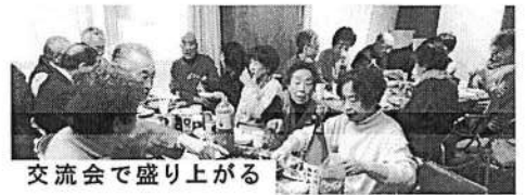
交流会で盛り上がる

11月と1月で2名の会員が増えたこと、しかし死亡や転居などで5名が退会となったことが報告され、今年は5名加入をめざすこととしました。最後に昨年度の役員を再任し欠員となっていた会計に新役員を選出して支部大会は終わりました。続く新年会で、60代の新人組合員が「年金組合は楽しそうな活動したいので、私も楽しみたい」と抱負を述べました。2人の新入組合加入で活気のある総会、新年会となりました。