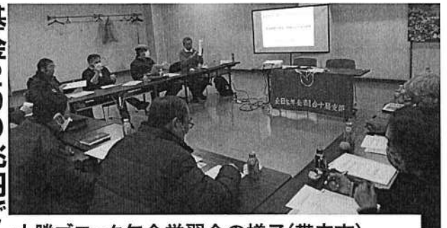
十勝ブロック年金学習会の様子(帯広市)

2025年の年金引上げ率は1.9%になる。この間、7.8%の引上げ率で、実質年金は引き下げられている。マクロ経済スライドはきつぱり負担と福祉切り捨てで命と暮らしが危ない状況になりかねない。マクロ経済スライド導入の理由を現役世代の負担を減らすためと言っているが、現役世代の年金も大幅に減額されます。政府は私たちの年金を上げています。株価を引き上げます。