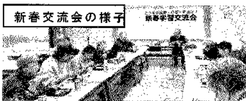
新春交流会の様子