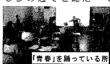
「青春」を踊っている所