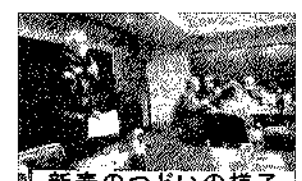
新春のつどいの様子

「うたごえ」などもあり楽しい集会となりました。嬉しいことに男性の方が加入してくれました。