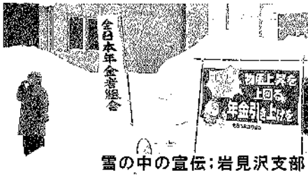
雪の中の宣伝:岩見沢支部

敬老パス署名101筆集約 この日、札幌市議会で敬老パスの審議があり、札幌市内の支部は、主に敬老パスの署名に集中しました。その結果、札幌市内