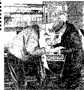
名寄支部 最北の宣伝署名行動

〒003-0801 札幌市白石区菊水1条4丁目1-5-202 Tel 011-815-6338 Fax 011-876-8511 E-mail donenkin@sirius.ocn.ne.jp